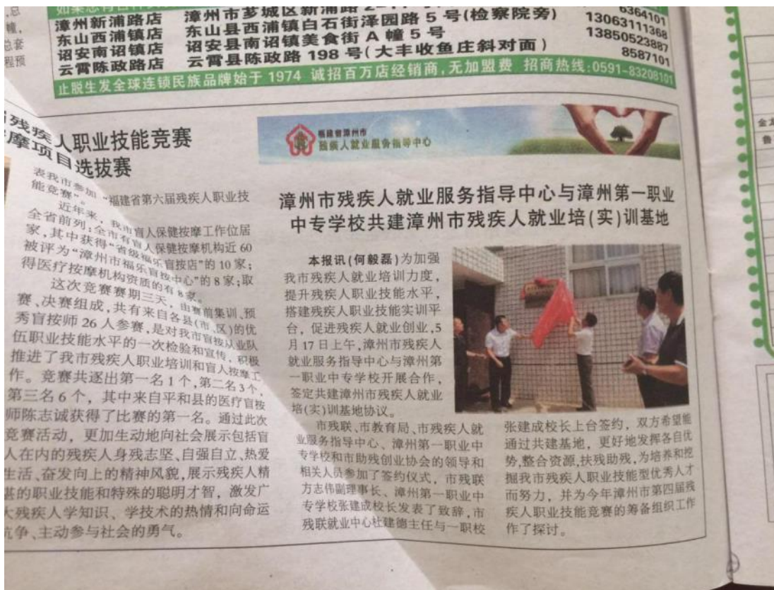
(漳州广播电视截图) 漳州市残疾人就业指导中心与漳州一职校共建培(实)训基地