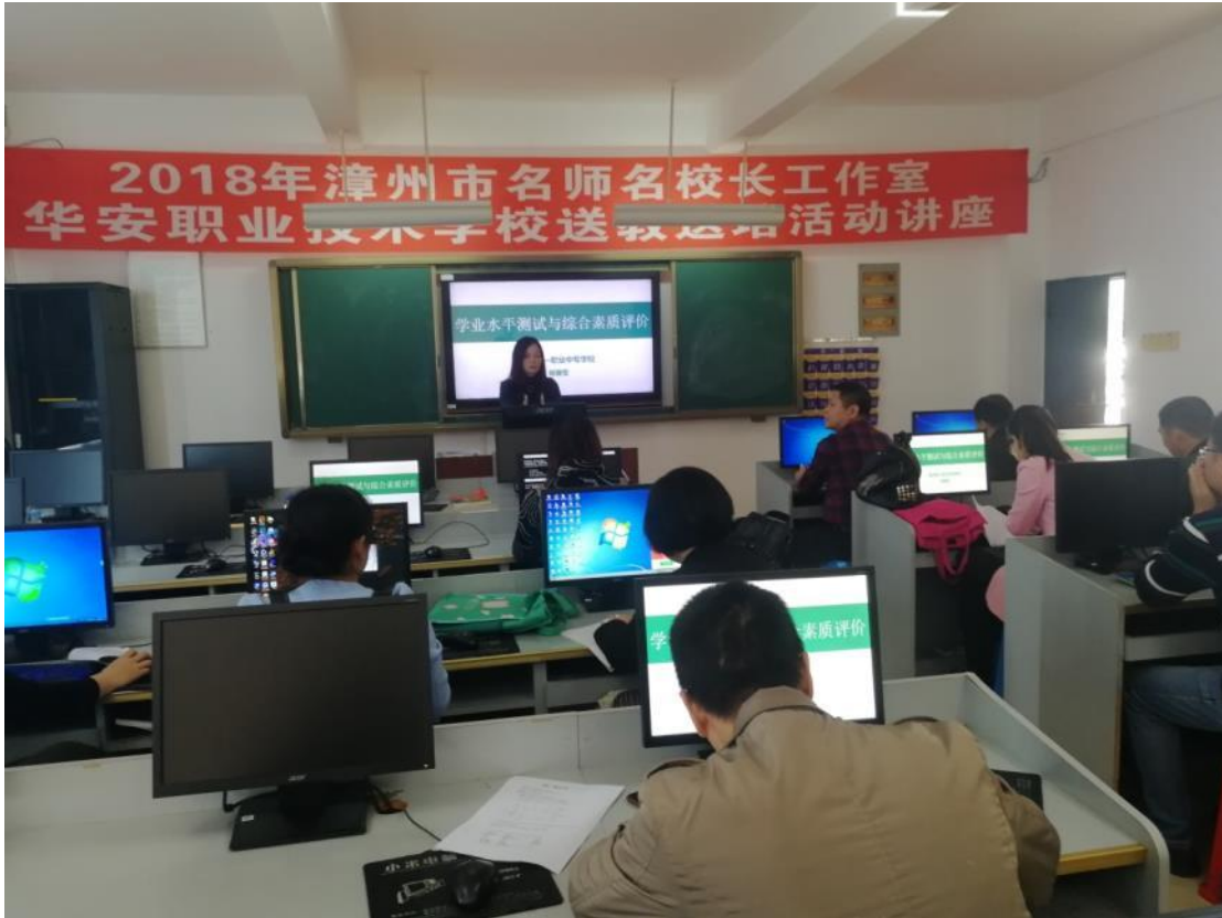
2018 年工作室送教送培