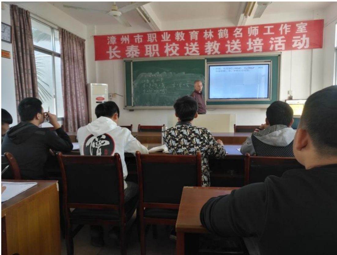
2017 年工作室送教送培