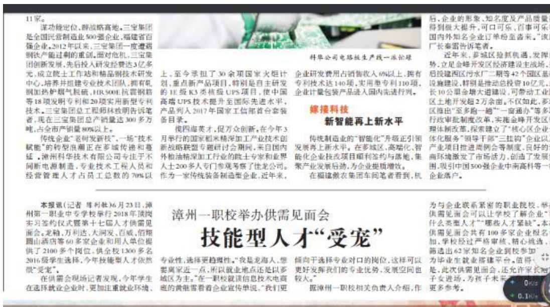
2018 年供需见面会 (闽南日报)