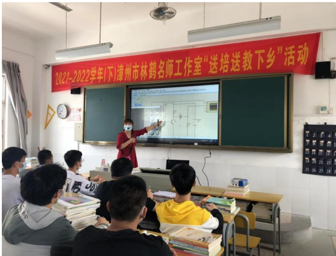
2022年工作室送教送培