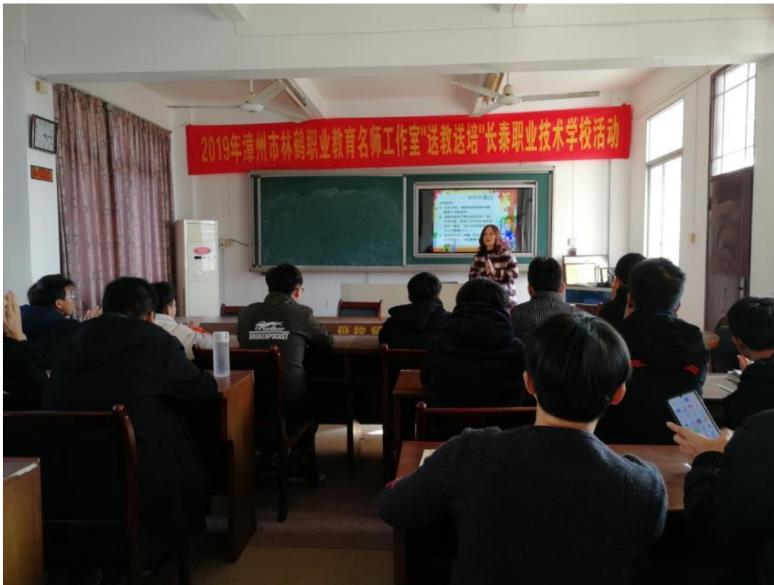
2019年工作室送教送培