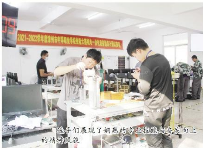
选手们展现了娴熟的专业技能与奋发向上的精神风貌