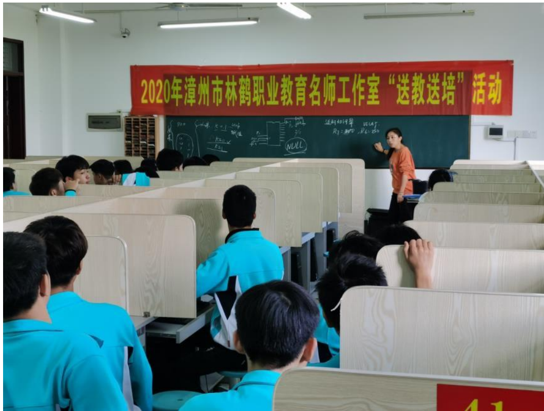
2020年工作室送教送培