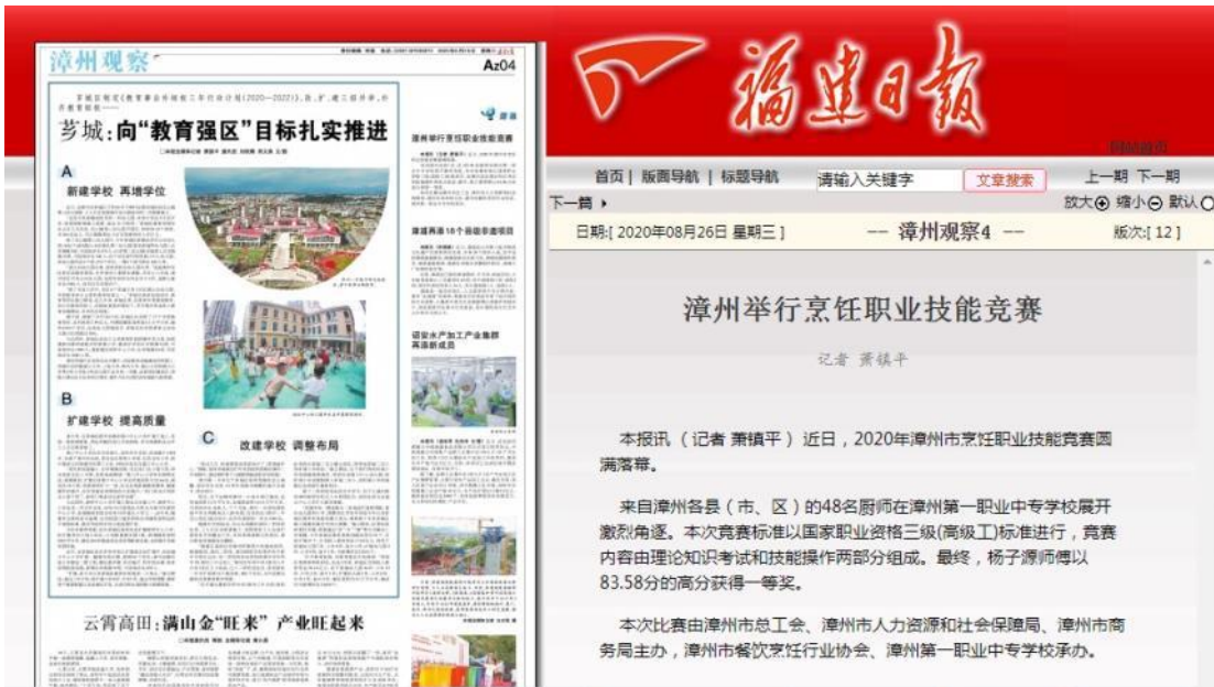
福建日报——漳州一职校承办 2020 年漳州市烹饪职业技能竞赛