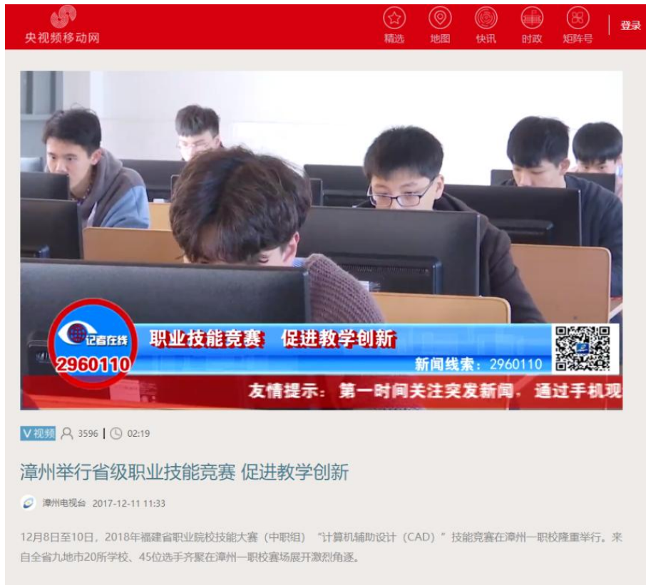
2017 漳州举办省级职业技能竞赛——漳州电视台