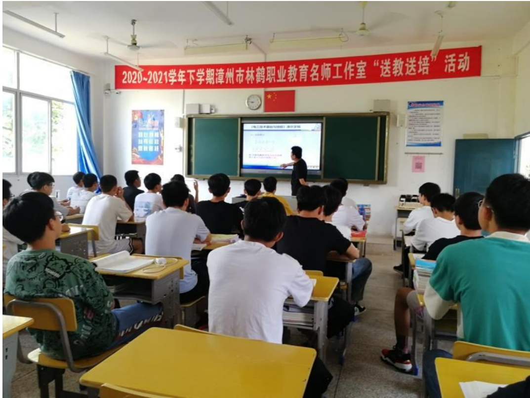
2021 年工作室送教送培