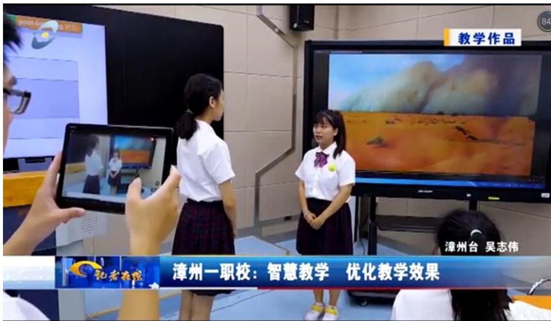
漳州电视台记者在线宣传漳州一职校：智慧教学 优化教学效果