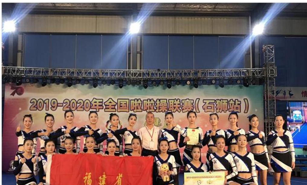
漳州市教育局报道我校学生参赛情况