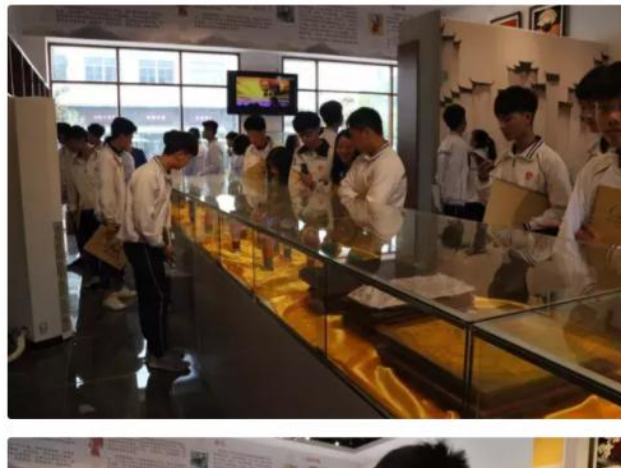
与福建永润文化旅游创意园校企合作项目挂牌及师生实践学习——今日头条

今日上午，漳州第一职业中专学校文化艺术学部的师生就早早来到了园区，参观了漳州市首家综合性文创产品馆——永润文创馆。