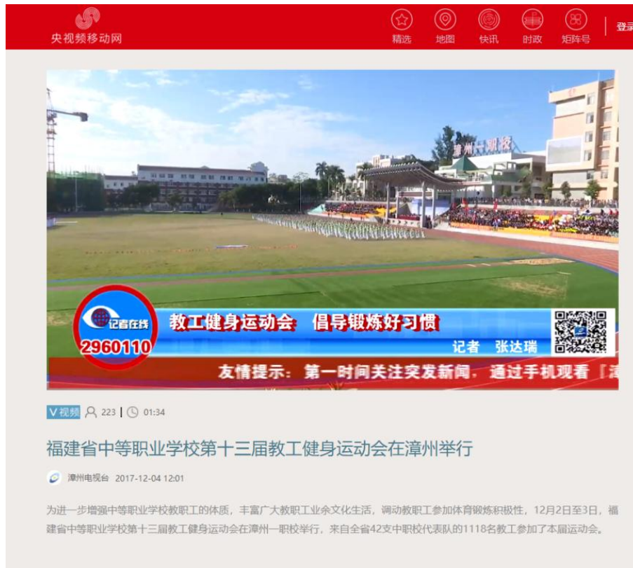
福建省中等职业学校第三十届教工健身运动会——漳州电视台